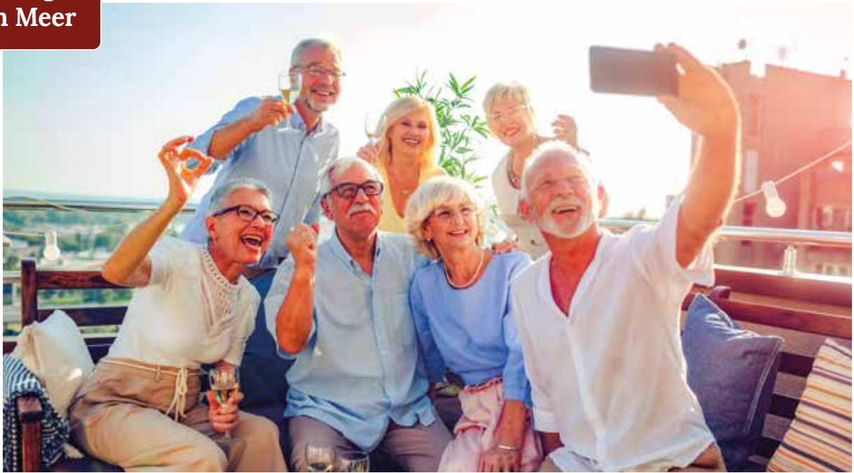
Gemeinsame Urlaubsmomente – Zeit für persönliche Erinnerungen