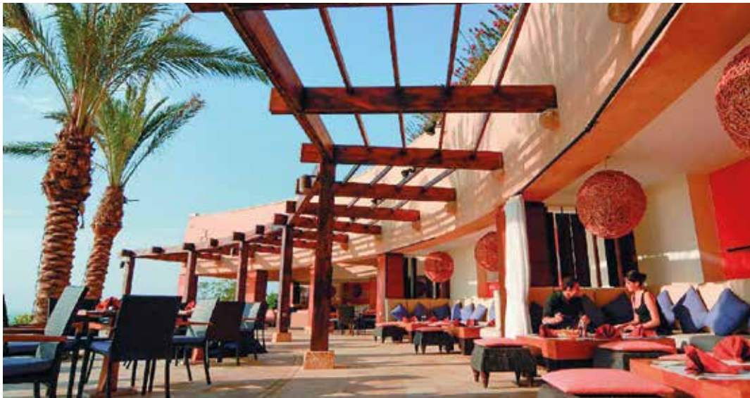
Genießen Sie die gemütliche Atmosphäre