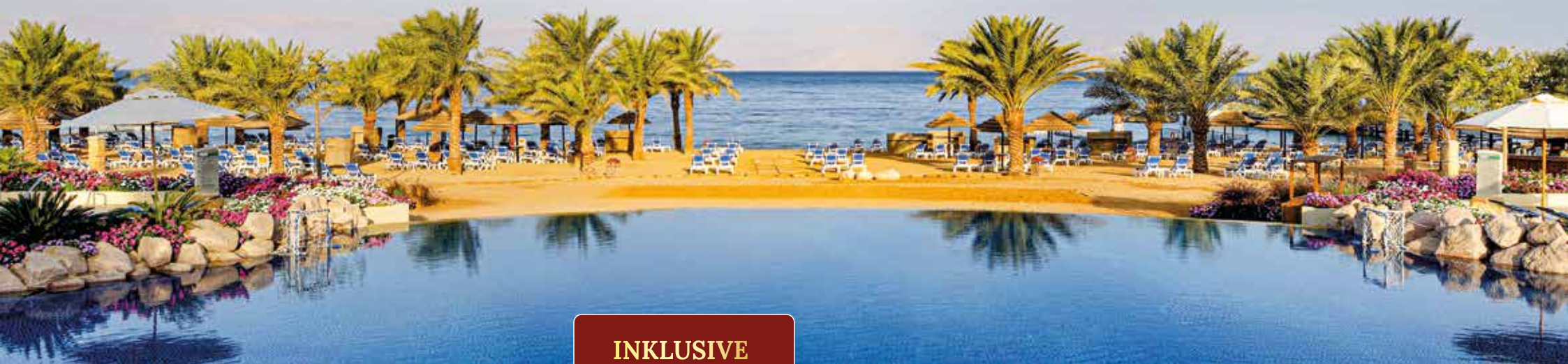
Fantastischer Ausblick über das Meer