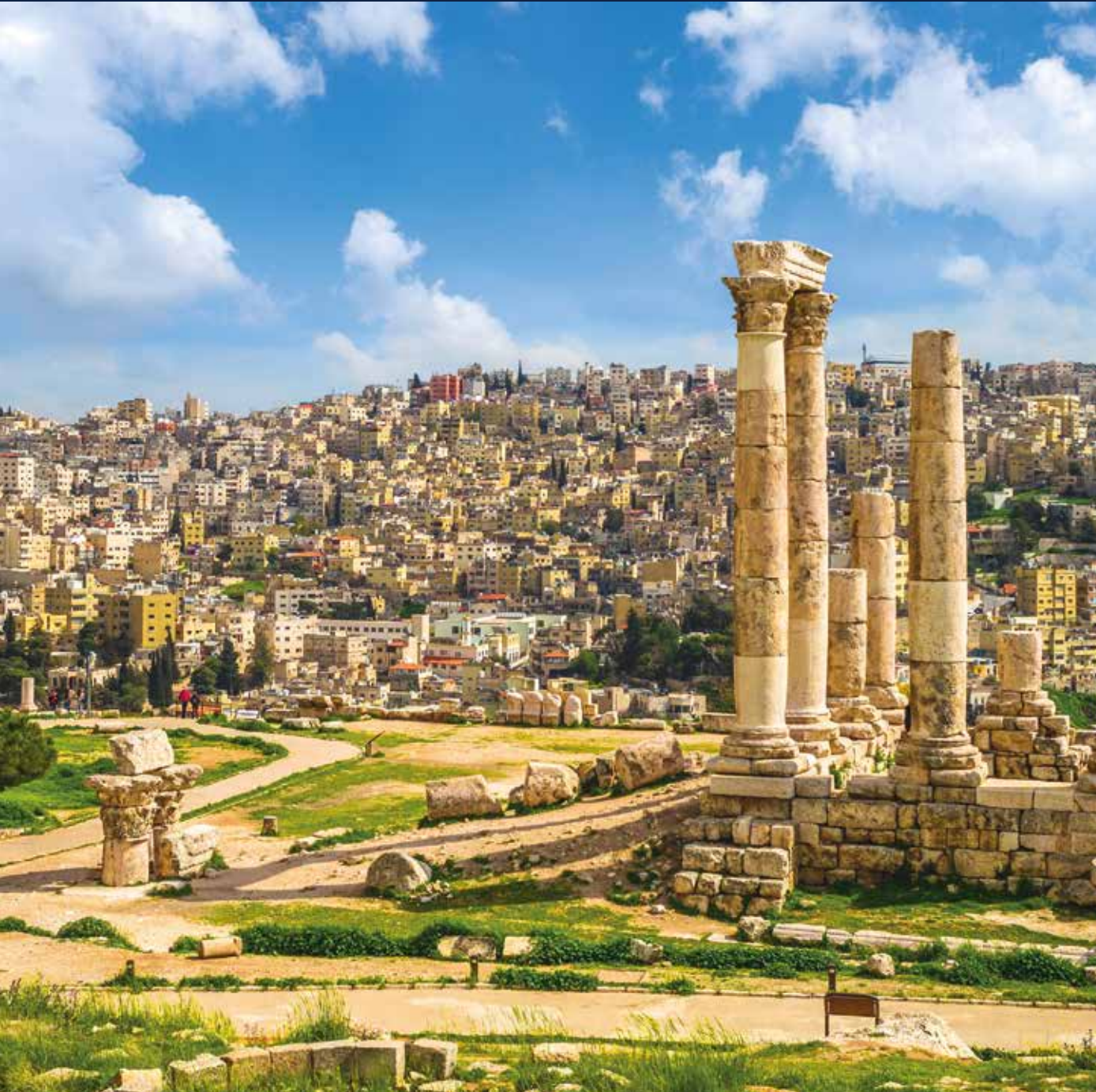
Amman zählt zu den ältesten dauerhaft besiedelten Städten der Welt