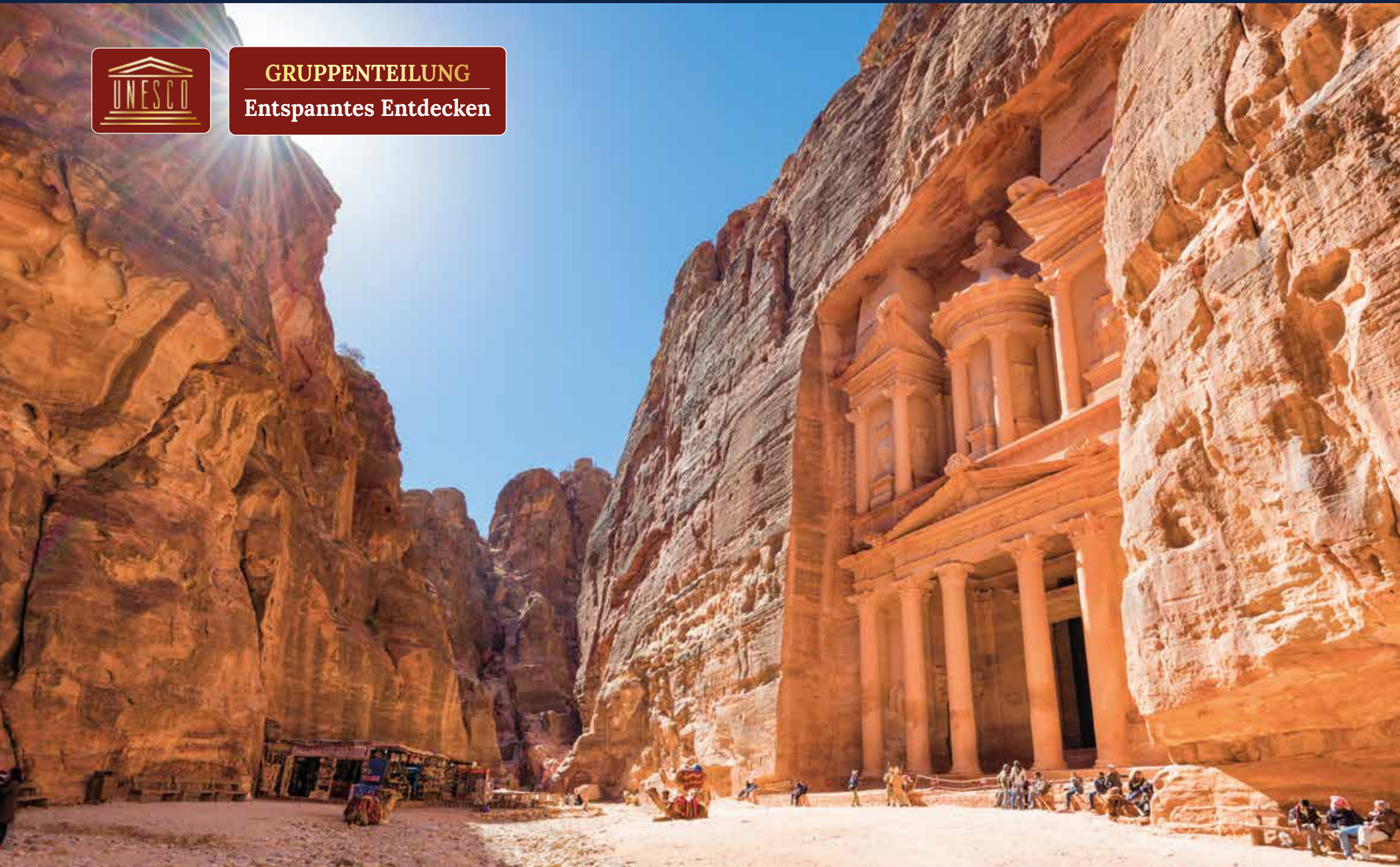
Das Schatzhaus Khazne al-Firaun ist das berühmteste Gebäude Petras – die Fassade ist fast 40 Meter hoch und 25 Meter breit