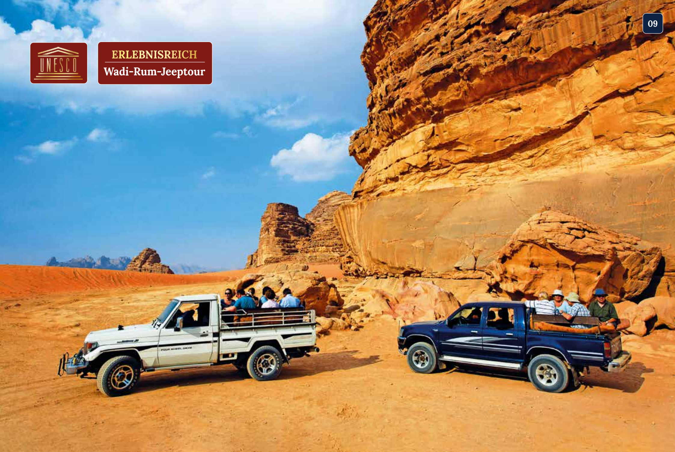
Am Morgen verteilen wir uns auf mehrere offene Geländewagen und fahren in Begleitung jordanischer Beduinen durch die Wüste