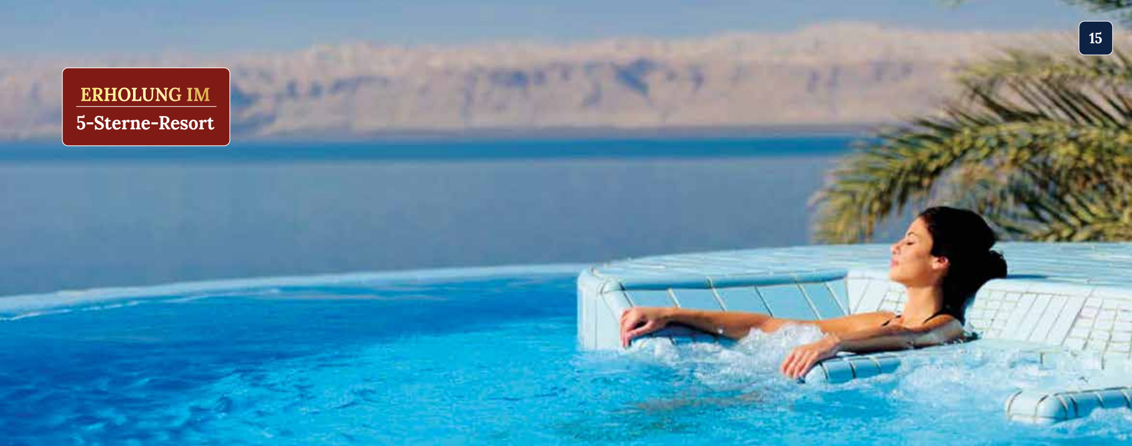
Zahlreiche Rückzugsorte sorgen für entspannte Momente während unseres Aufenthalts