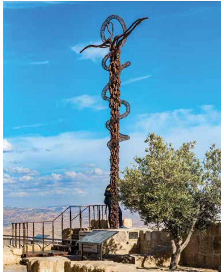
Ausblick vom Berg Nebo über das Gelobte Land