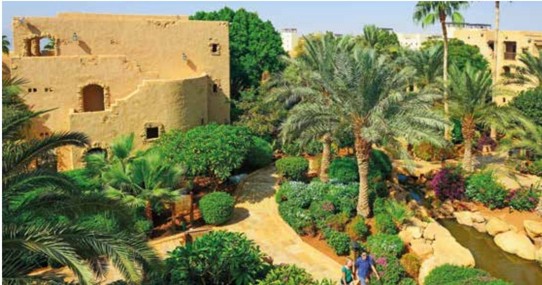
Die weitläufige Gartenanlage lädt zum Spaziergang ein