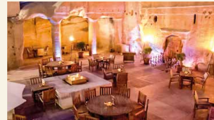
Lounge im Felsbereich des Hotels