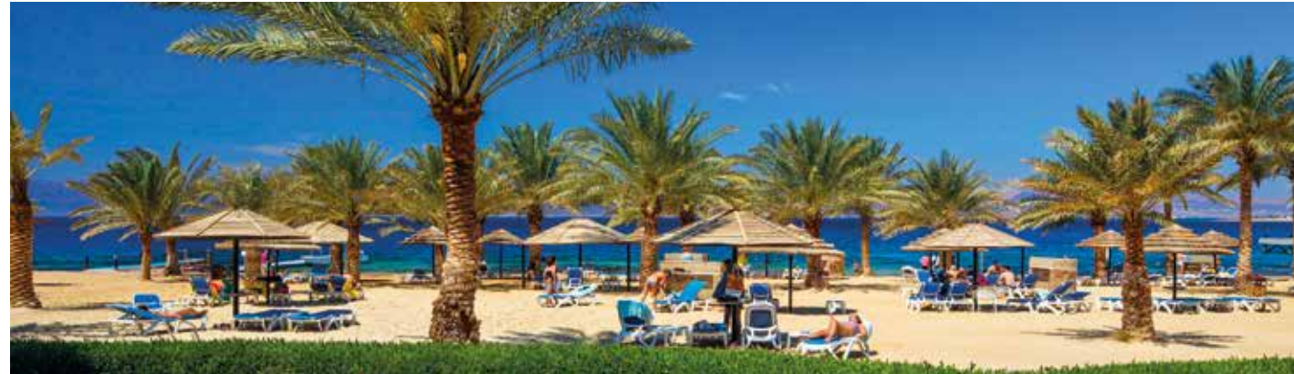
Palmenstrand am „Mövenpick Tala Bay“ – unser 5-Sterne-Resort am Roten Meer