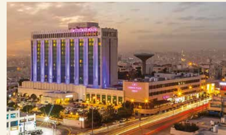
Unser Hotel „Crowne Plaza“ in Amman