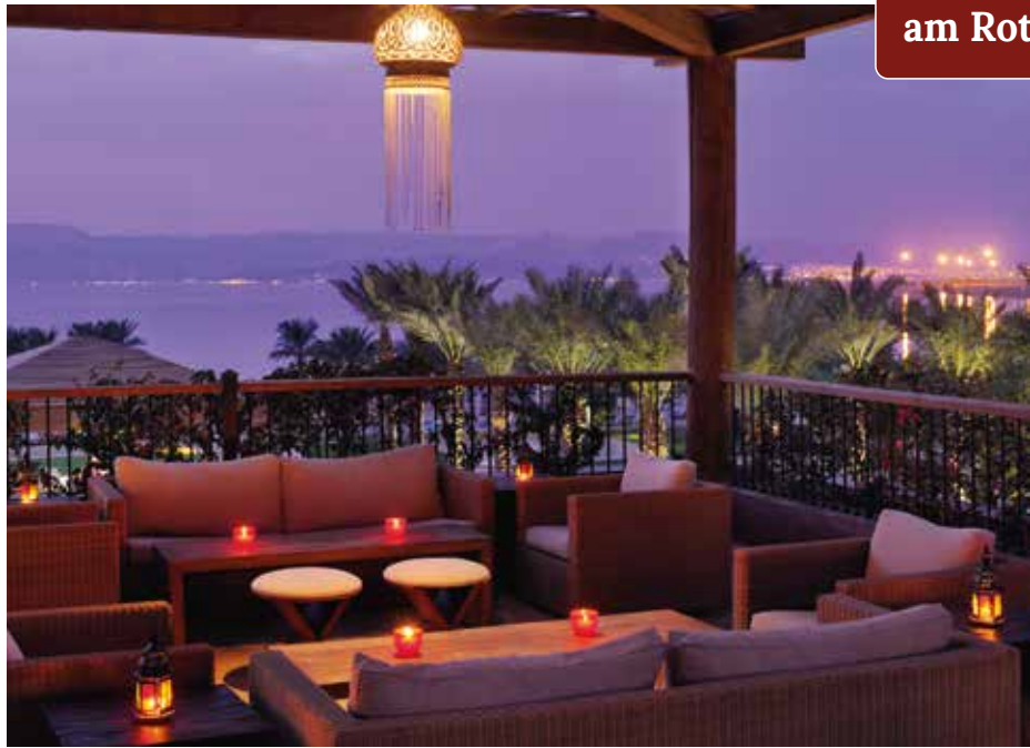
Die gemütliche Hotellounge lädt zum abendlichen Verweilen ein