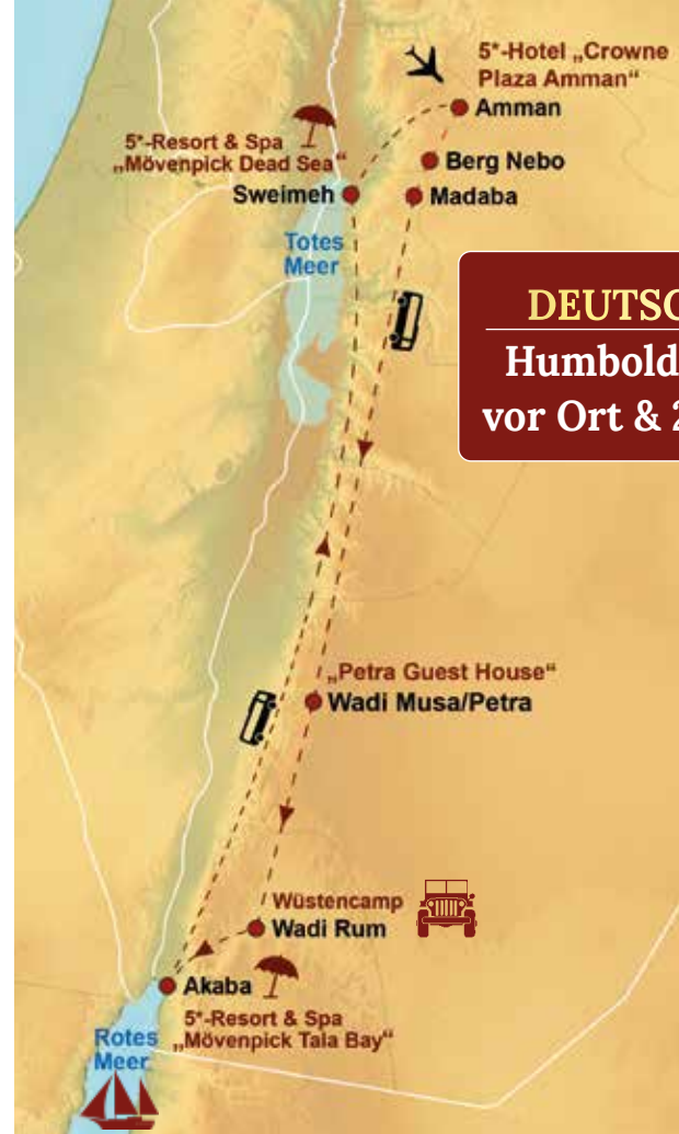
Unsere Reiseroute im Überblick

Bei uns sind Sie in guten Händen! DRV MITGLIED