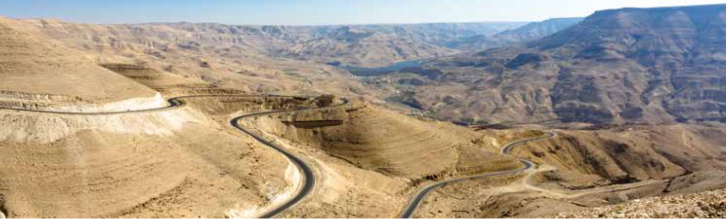
Historische Route – die 400 Kilometer lange Königsstraße wird bereits im Alten Testament erwähnt