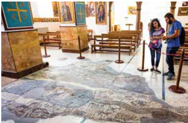
Madaba ist bekannt als „Stadt der Mosaik“

Madaba ist für seine frühchristliche Sakral-kunst bekannt, darunter das berühmte Mosaik der Landkarte des Heiligen Landes in der St.-Georgs-Kirche. Die Stadt gilt als eines der wichtigsten Zentren dieser kunst-geschichtlichen Entwicklung im Nahen Osten.